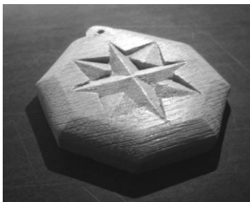
Рисунок – Сувенирный медальон

Процесс творческого поиска художественного и конструктивного решения изделия опирается на анализ учебной программы по техническому труду и выбор разделов, по которым будет выполняться изделие. В нашем исследовании из инвариантной части учебной программы анализируется раздел по обработке древесины, а из вариативной – художественная обработка древесины. Соответствующим изделием может выступать сувенирный медальон. Мы выбрали простую форму, небольшой размер и узор, получив оригинальное изделие, вполне удовлетворяющее задаче развития творческих способностей обучающихся (рисунок).