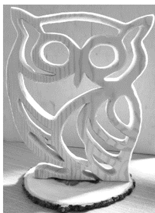
Рисунок – Сувенирное изделие «Сова»

В результате экспериментальной работы установлено, что изготовление подобного изделия требует 10 часов, что эквивалентно 14 полным урокам. Изделие достаточно сложное, но его можно предлагать к изготовлению учащимся шестых и седьмых классов, у которых спаренные уроки (рисунок).