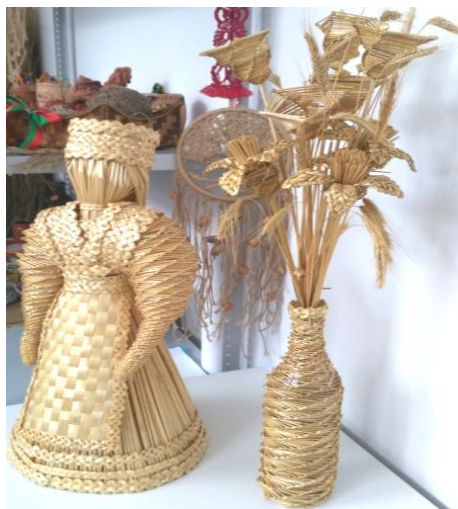
Рисунок – Творческий проект «Изделия из соломки»

Еще одной из востребованных форм реализации творческих возможностей уроков трудового обучения является организация работы творческих мастерских. Творческая мастерская – это не столько помещение, сколько форма учебной и внеклассной работы. Методика и организация этой работы позволяет привлечь многих учащихся к самым различным видам деятельности, поддерживать интерес к ней в течение длительного времени. Преимущества творческих мастерских заключаются в том, что все учащиеся имеют абсолютно равные возможности в отношении занятий той или иной практической деятельностью, приобщаются к многоплановому самостоятельному творческому труду, что способствует эффективному выявлению и развитию их склонностей и способностей.