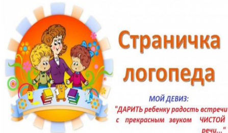
Рисунок – Страничка логопеда [1]

Учитывая огромные профессиональные потребности педагога, в последнее время наблюдается появление в сети Интернет ряда интернет-страниц, сайтов-визиток, персональных сайтов практикующих логопедов (рисунок).